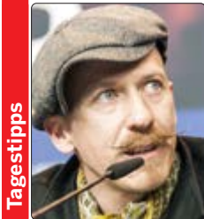
Foy Vance trat im September 2022 in Berlin auf